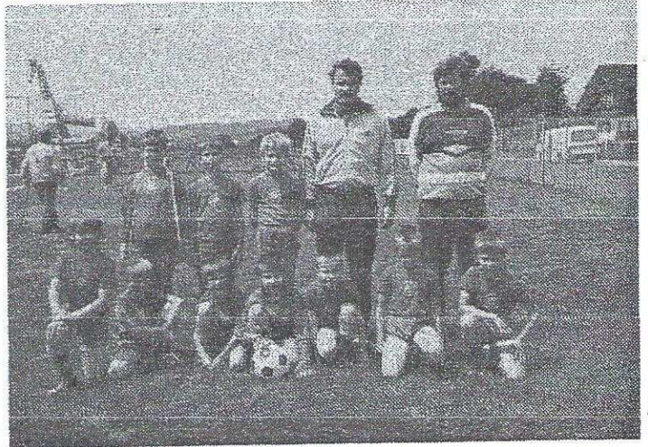
... vor einem Jahr noch undenkbar - die Jugendmannschaft von Lokomotive Leipzig in Durach.