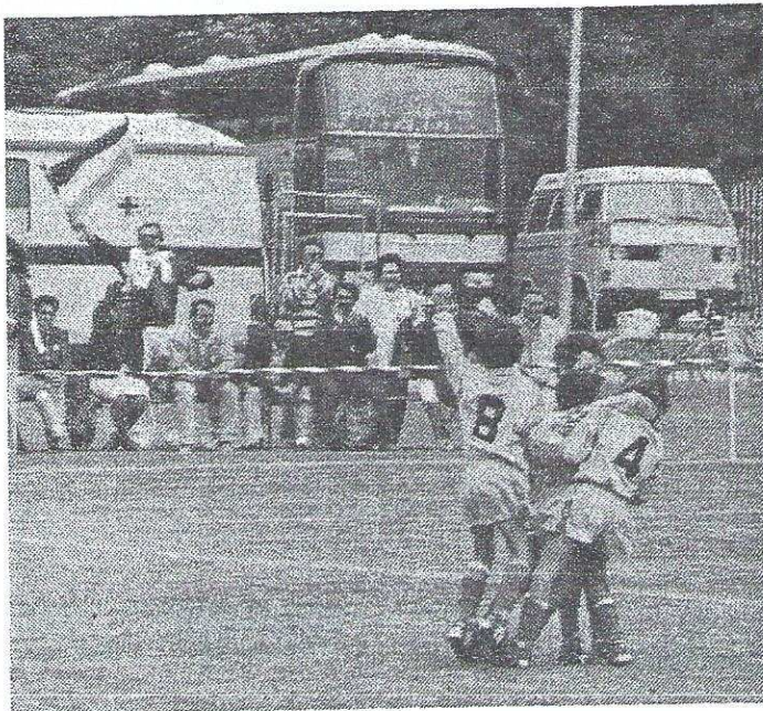
... Torjubel auf italienisch (die Spieler und Eltern von Hellas Verona freuen sich über den 1:1 Ausgleich im Endspiel gg. Austria Wien)