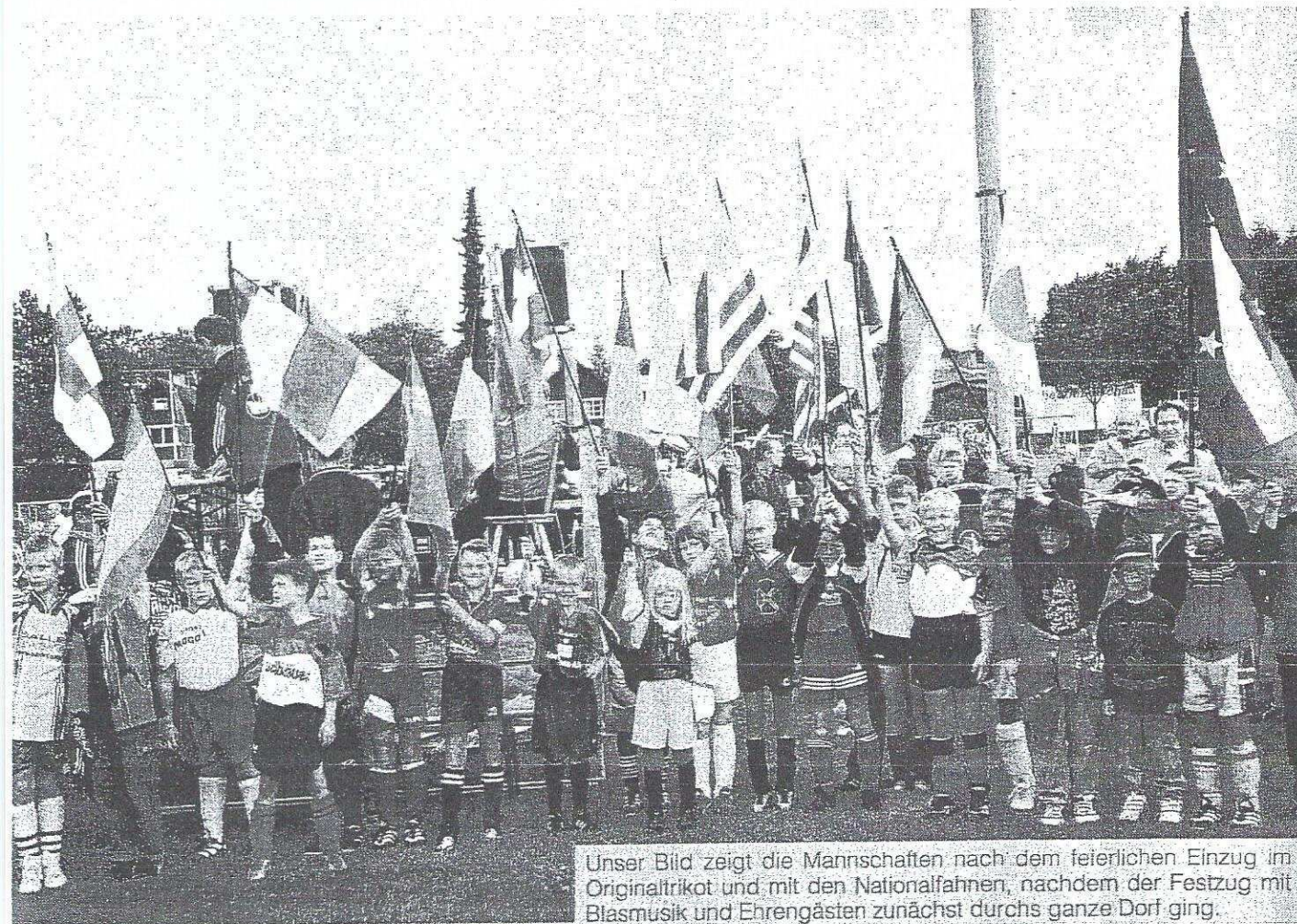
Unser Bild zeigt die Mannschaften nach dem feierlichen Einzug im Originaltrikot und mit den Nationalflaggen, nachdem der Festzug mit Blasmusik und Ehrengästen zunächst durchs ganze Dorf ging.

4 Mannschaften aus der Region Allgäu eiferten ganz ihren großen Vorbildern nach.